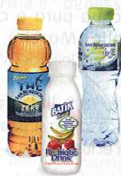
In alto, le nuove bottiglie Acqua minerale San Benedetto

Essere presente inoltre con gamme specifiche per una perfetta copertura di tutti i canali distributivi, da quelli classici fino al vending per garantire la maggiore prossimità possibile al consumatore. Tutto questo è l'impegno globale di San Benedetto, un impegno in linea con la propria mission: Risorse per la Vita , da sempre alla base della sua continua crescita e che ne traccia il sentiero anche per lo sviluppo futuro.