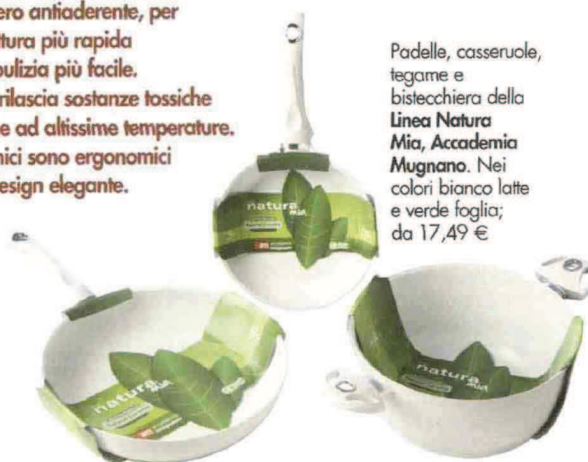
Padelle, casseruole, tegame e bisticchiera della Linea Natura Mia, Accademia Mugnano. Nei colori bianco latte e verde foglia; da 17,49 €